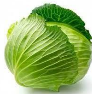
Бай – цай